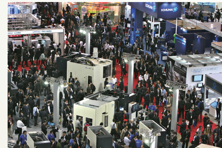
前回開催JIMTOF2016会場風景

本の仕上がり寸法はA4変形判(280mm×210mm)です。ブリード版の場合、原稿寸法は上記仕上がり寸法に4方(天地・左右)にそれぞれ3mmプラスしてください。