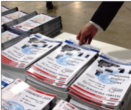
会場配布イメージ