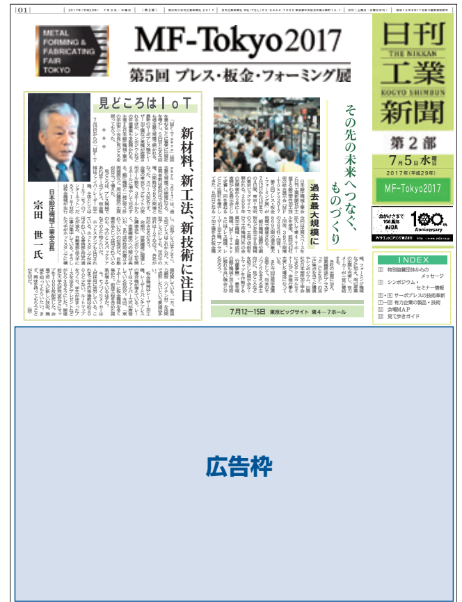
▲掲載イメージ(2017年7月5日発行紙面)