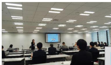
メタウォーター株式会社様 SDGs懇談会の様子 (2020年10月29日開催)

学生や女性の参加が目立ち、スマートフォンで参加者からの意見を素早く収集できるツールを使い、対話の機会を多く設けたイベントとなりました。